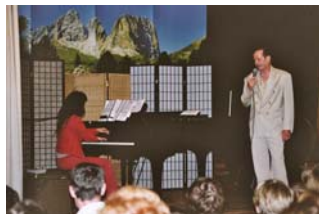
Soirée de présentation